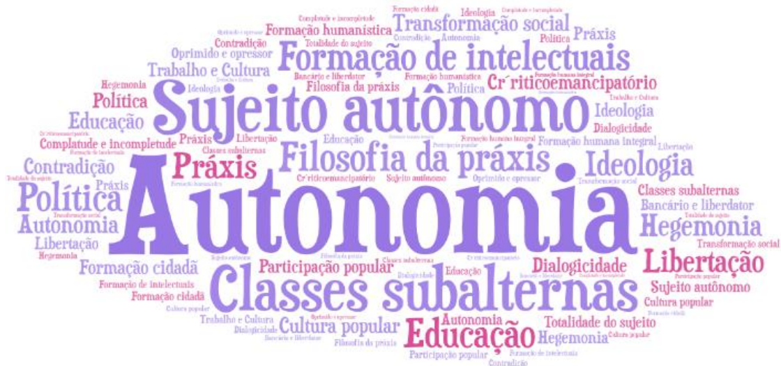
Figura 1 - Palavras comuns vinculados à formação humana integral

Fonte: Elaborada pelo autor, com base na pesquisa bibliográfica envolvendo os artigos do quadro 1 (2022)