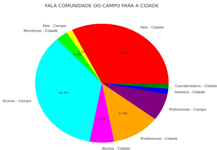
Figura 2: Elaborado: David Alves Pires, 2025.

Dos vinte e dois pais e/ou responsáveis, apenas um respondeu que se sente pertencente ao campo, vinte e um responderam que se sentem pertencente a cidade, as duas monitoras responderam que se sentem pertencente a cidade, dos vinte e oito alunos vinte e quatro responderam se sentirem pertencente ao campo e quatro da cidade. Salientando que os alunos antes de responderem essa pergunta no questionário dado para eles, tiveram muitas dúvidas sobre pertencer ao campo, fazer parte da comunidade camponês, na realidade eles nem tinham noção que a escola era do campo. para fomentar essa pesquisa destaca-se o gráfico abaixo: