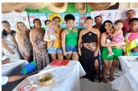
Figura 4: Participação de Pais e Responsáveis. 19 de novembro de 2025.

Ainda houve uma apresentação de etnia, onde os alunos teriam que relatar oralmente: Bom dia, meu nome é... tenho__ anos e sou do 4º ao B, estou usando uma blusa ... uma calça... sapato... a cor do meu cabelo é... a cor dos meus olhos são..., minha etnia é... agora vou apresentar minha mandala, e assim relatavam o tema e sua própria história, abrangendo o pertencimento de cada um a sua vivência. Eles confeccionaram violões com materiais recicláveis para a produção da decoração.