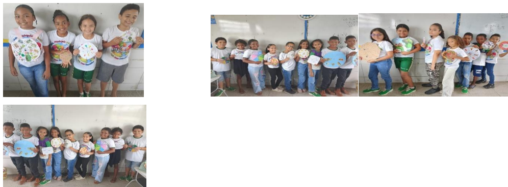
Figuras 7: Confeção das Mandalas pelos alunos. Explicando sua história e seu pertencimento, 19 de novembro de 2025.