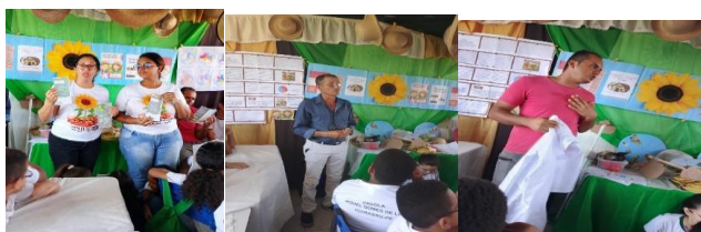
Figuras 6: Palestra das Professoras do 5º ano, Pai Artesão e Avô Pescador, 19 de novembro de 2025.

professoras do 5º ano distribuíram um folder para todos os convidados de uma proposta do Campo referenciada no Capítulo 2.6 com o Tópico PROJETOS E PROPOSTAS, PROFISSÕES E PROFISSIONAIS – REAVIVANDO IDENTIDADES - O projeto Quintais Produtivos: Cultivando em Casa e na Escola. Contribuindo assim com mais ênfase a valorização dessa Mostra. O local dessa Mostra foi a própria sala de aula da turma do 4º ano. Algumas crianças tiveram a oportunidade de expor seus artesanatos de sua inteira criatividade, pulseiras, bolo, colares, etc. Para a permissão dos Pais e Responsáveis foi elaborado um convite em que eles assinassem o próprio nome e do aluno para organização e proteção no ambiente escolar.