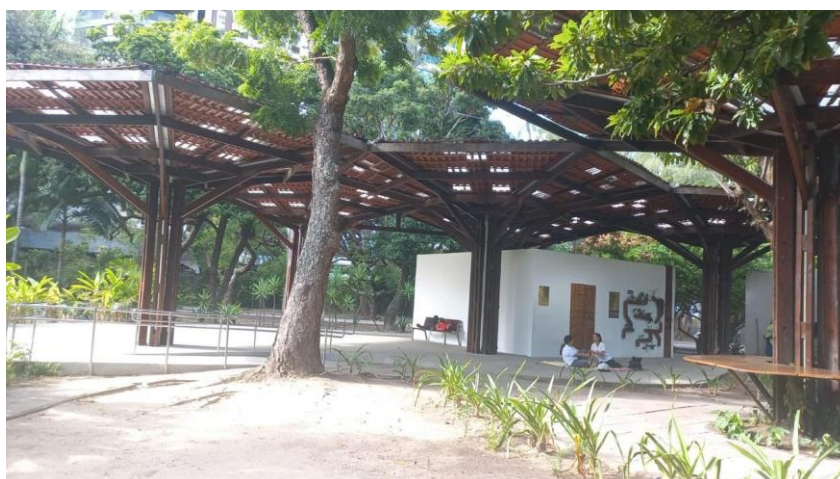
Imagem 2 - O econúcleo

Além disso, houve a participação de profissionais de saúde, como nutricionistas, terapeutas ocupacionais, massoterapeutas, pneumologistas e odontólogos, bem como educadores. A programação também incluiu atividades como a produção de slime, uma massinha moldável feita manualmente, oficinas de lettering, voltadas à criação artística de letras e palavras, além de oficinas de cupcake (mini bolos) e uma discoteca.