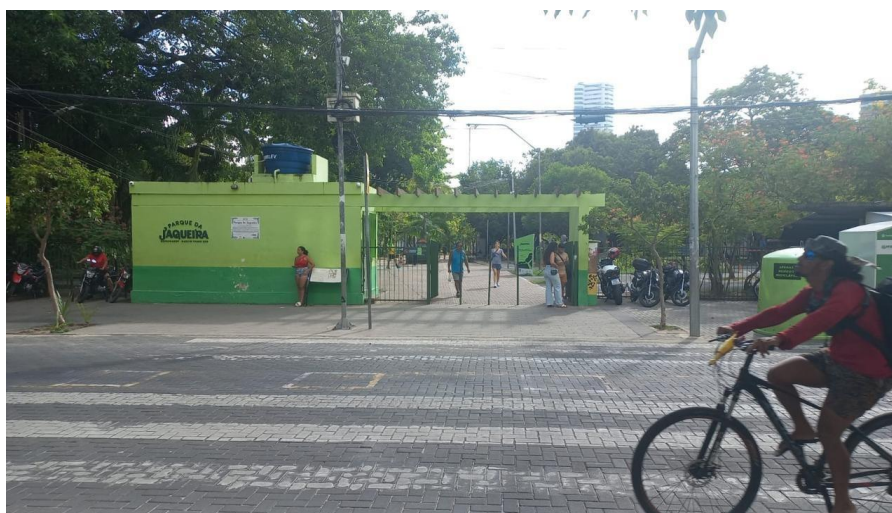
Imagem 1- Entrada principal do Parque da Jaqueira.

Só em 1984, como prefeito da cidade estava Joaquim Francisco, que então começou uma campanha para que o local virasse um grande parque do Recife. O lugar até então era de propriedade do Instituto de Seguridade Social (INSS) que tinha como objetivo transformar em um residencial. No entanto, o terreno foi cedido por meio de contrato para a prefeitura do Recife.