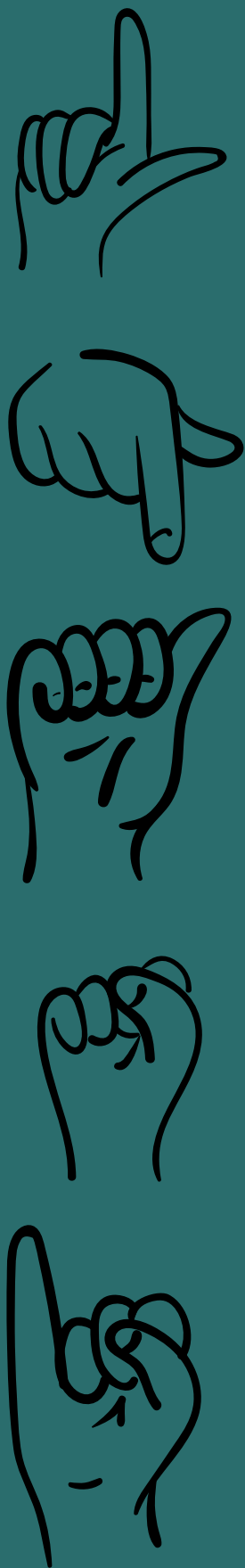
Descrição da imagem: Sinais de letras em libras na lateral da página.

Essa mesma Lei também traz a responsabilidade para o Estado, a família, a comunidade escolar e a sociedade, no sentido de assegurar uma educação de qualidade para as pessoas com deficiência, protegendo-as dos diversos tipos de violência, negligência e discriminação, que é a forma pela qual o preconceito se manifesta. Fonte: (Sonza, 2023)