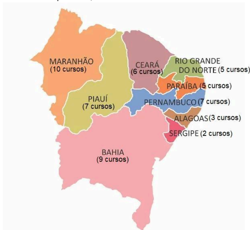
Figura 1 – Distribuição por estados da federação dos cursos de enfermagem que compuseram a amostra final do estudo. Pesqueira-PE, 2024.

Entre as IES que compuseram a amostra final deste trabalho, as que possuíam maior quantidade de cursos de enfermagem estavam localizadas nos estados do Maranhão (n=10) e da Bahia (n=9). Já os estados com menores quantidades de cursos foram Sergipe (n=2) e Alagoas (n=3), como pode ser verificado na figura 1.