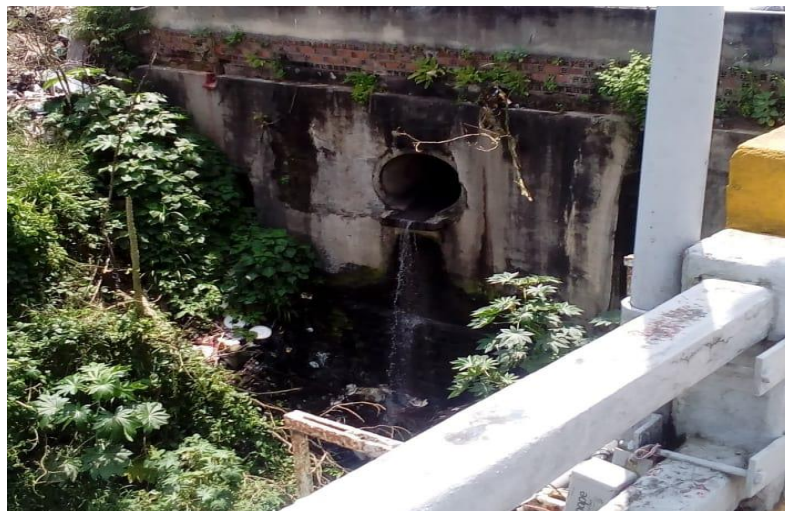
Figura 3. Esgoto lançado direto no Rio Capibaribe

desmatamento da mata ciliar para atividades agrícolas e pecuaristas, esgoto industrial, descarte de resíduos sólidos, podendo contatar outros problemas.