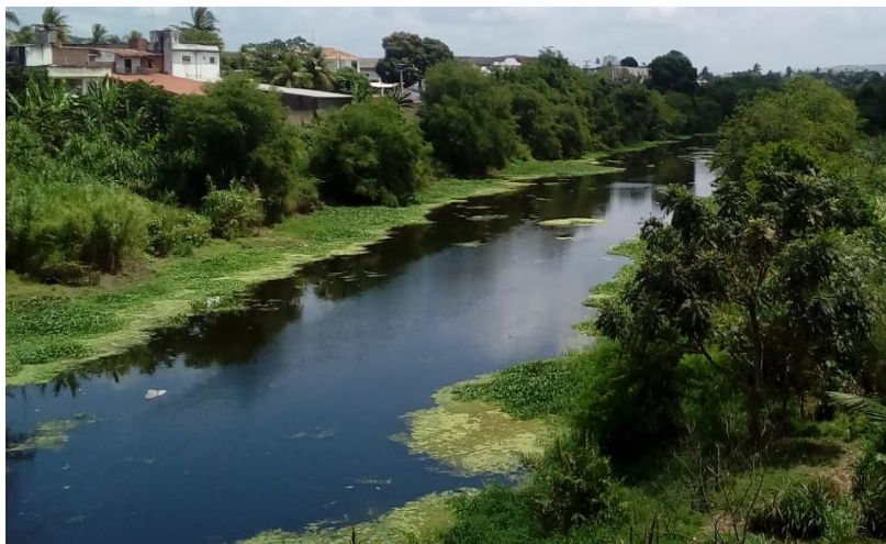
Figura 2. Trecho do Rio Capibaribe corta a cidade/ Limoeiro-PE

A pesquisa tem como área de estudo o trecho urbanizado do Rio Capibaribe que corta o município de Limoeiro (figura 2). O Rio Capibaribe nasce nas Vertentes da Serra do Jacarará município de Poção e na divisa de Jataúba, o Capibaribe deságua no oceano Atlântico O seu nome é de origem TUPI, e tem como significado Rio das Capivaras ou Porcos Selvagens.