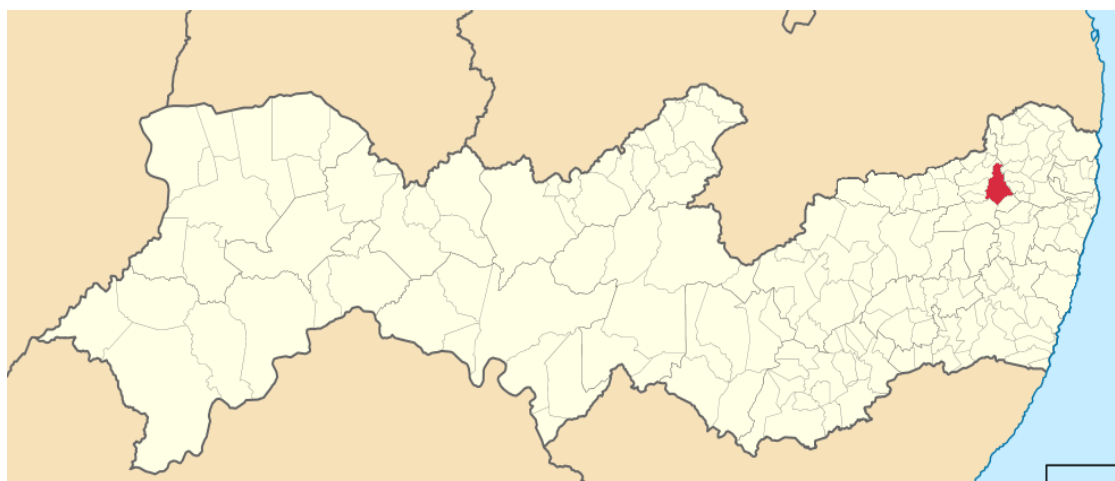
Figura1. Mapa de localização do Município

O seguinte estudo discorre no município de Limoeiro, situado no estado de Pernambuco. Localizado na Mesorregião do Agreste pernambucano, e na Microrregião do médio Capibaribe e de clima semiárido (Figura 1). A sede do município está situada na bacia do Capibaribe, localizada a 77 km da capital pernambucana, tendo como sua principal rota acesso a capital, a PE 90 e a BR 408.