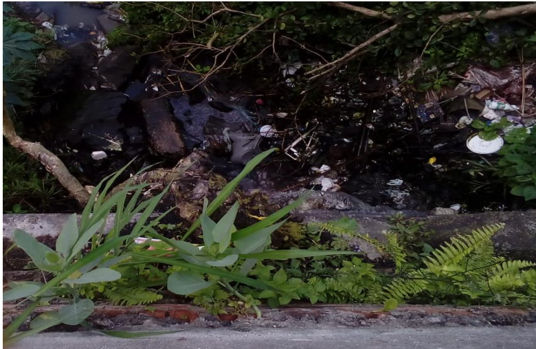
Figura 6. Descarte de lixo no rio Capibaribe