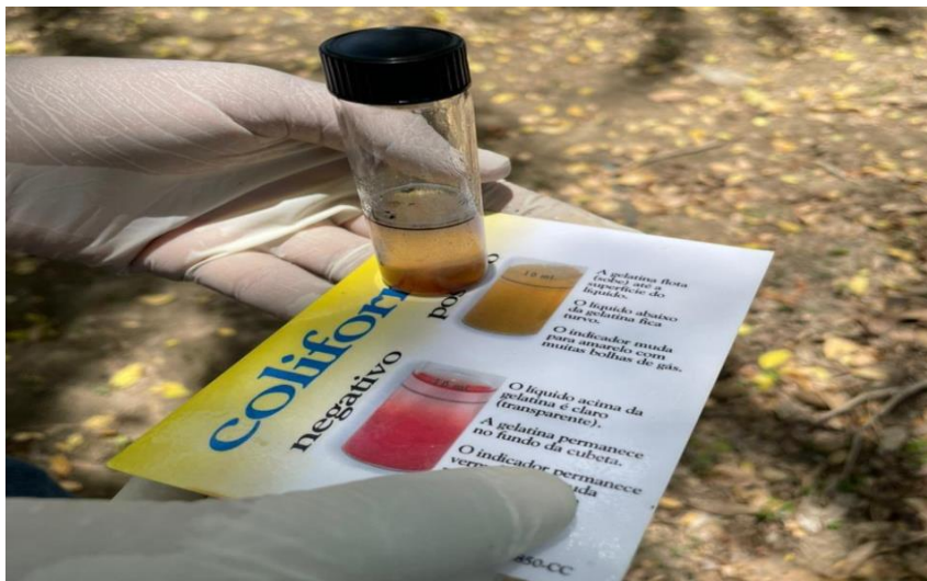
Figura 7: Coliformes totais positivo

levam negatividade para a vida da população, todos relacionados ao processo de urbanização, onde muitas vezes as famílias vivem de forma decadente sem nenhum olhar de poder público, como pavimentação e organização, construções irregulares, onde põe em risco a saúde de muitos, a presença de coliformes encontrados na água apresenta risco de contaminação tanto para a população quanto para a agricultura existente em seu entorno. Uma outra análise sobre a qualidade da água foi coletada e testada pelo biólogo junto ao órgão responsável público, analisando a presença de coliformes (Figura 7), onde as fezes humanas contêm bilhões de coliformes (bactérias presentes no sistema digestivo humano), os quais são eliminados diariamente.