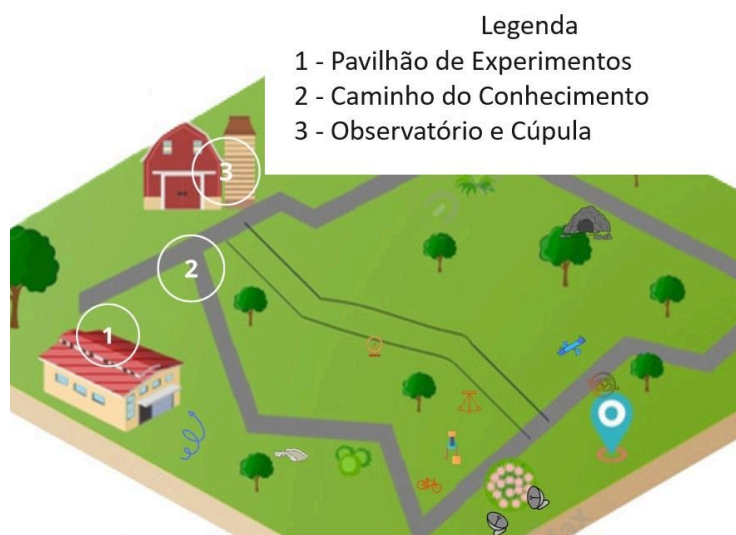
Figura 1: Mapa esquemático do Museu EICTA.

O Museu ainda é um ambiente em construção, atualmente conta com 38 experimentos científicos e tecnológicos tanto na área interna, como na área externa ver Figura 1 .