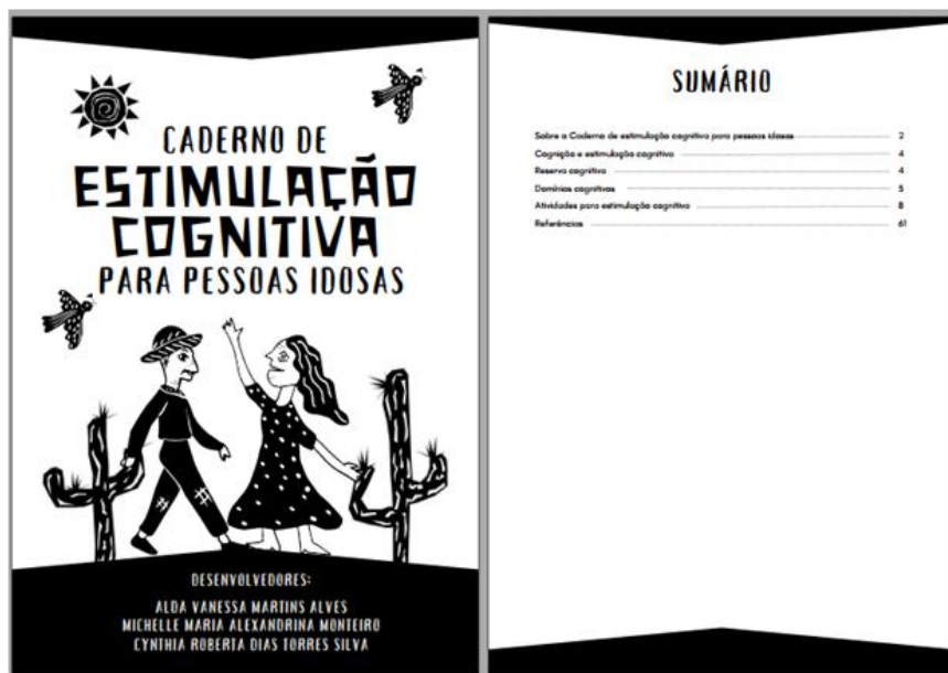
Figura 1. Recorte de trechos do material educativo (capa e sumário). Pesqueira, Pernambuco, Brasil, 2023.

O “Caderno de estimulação cognitiva para pessoas idosas”, em sua versão final, é composto por 63 páginas, divididas em seis sessões, nas quais apresentam-se informações sobre cognição e seus domínios, EC e reserva cognitiva, bem como as atividades e as referências. Das 50 atividades de estimulação cognitiva desenvolvidas, nove são classificadas como desafios, por possuírem nível de complexidade maior quando comparadas às outras. Tais atividades podem ser desenvolvidas individualmente ou em grupo, cabendo ao enfermeiro avaliar desde as condições de saúde e particularidades de cada indivíduo para responder cada atividade, bem como as que mais se adequam para serem realizadas grupalmente ou de modo individual.