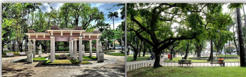
Fotografia 5 - Praça do Derby