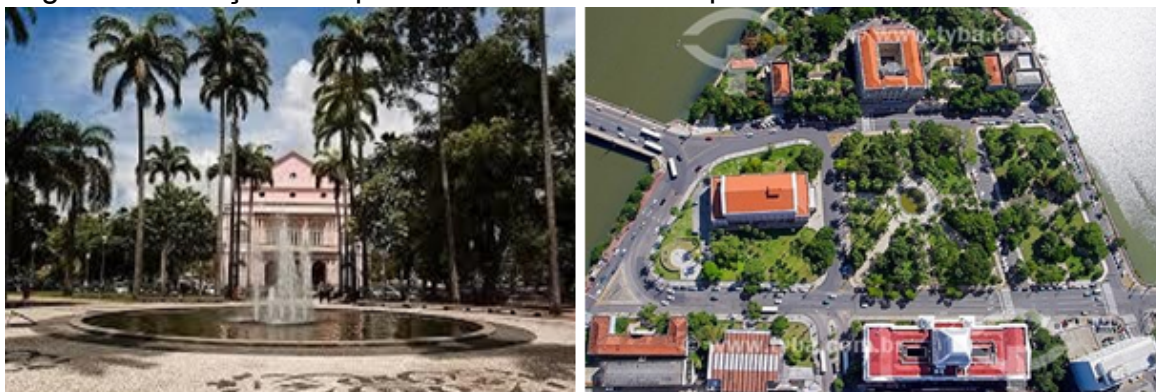
Fotografia 4 - Praça da República e Jardim do Campo das Princesas