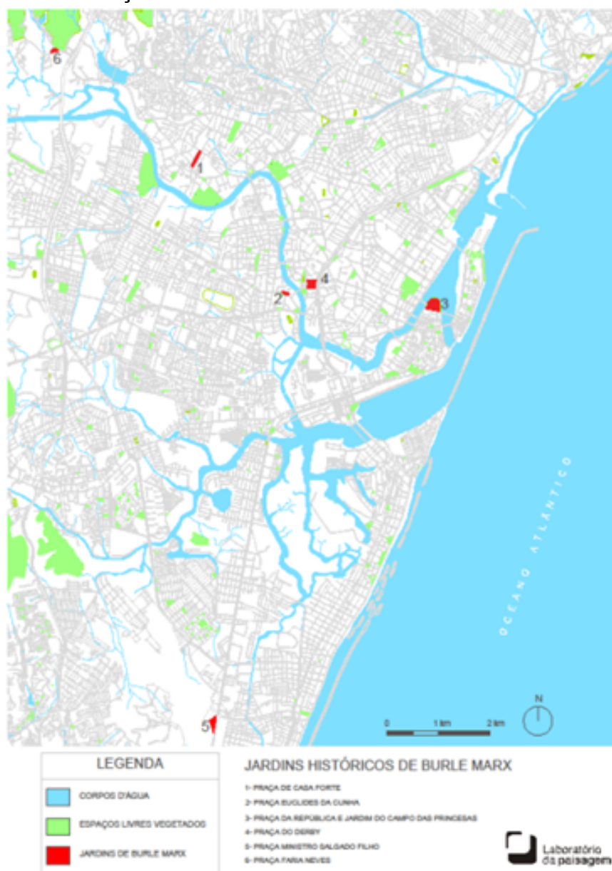
Mapa 1 - Localização dos Jardins Históricos de Burle Marx tombados pelo Iphan

Os jardins localizados nos pontos em destaque na figura 01 representam a matéria prima utilizada na primeira estratégia de elaboração do plano, assim como o detalhamento de cada ponto nas figuras de 02 a 07.