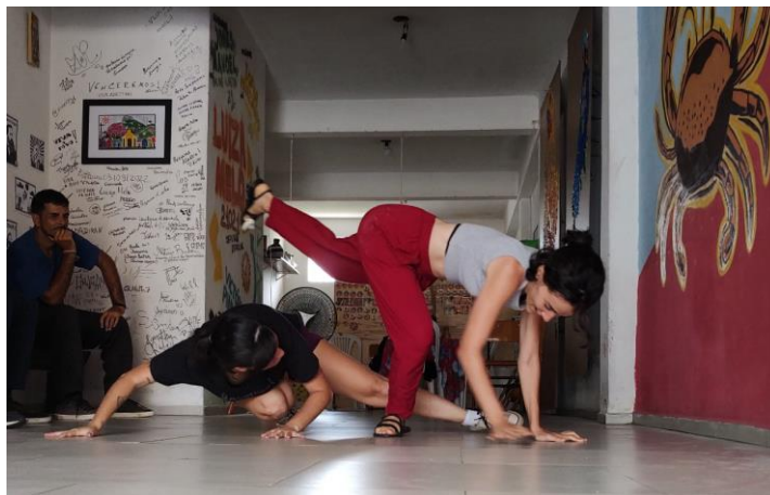
Figura 9 - Integrantes do Núcleo Bezerras executando movimentos de ataque e de defesa.

12 alunos Iniciantes, dentre homens e mulheres, adultos e crianças. Na Figura 9, duas dessas integrantes executam movimentos de ataque e de defesa durante um treino.