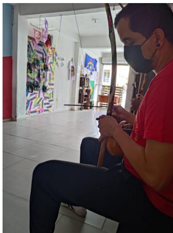
Figura 7 - Registro do pesquisador tocando um berimbau em uma das aulas.

A musicalidade faz com que o movimento corporal aconteça [...]. Bem que até no silêncio tem música, mas a gente entende que a musicalidade, com a instrumentação da nossa bateria, com os instrumentos, ali está mandando uma energia [...]. Está circulando a energia na roda para o jogo e a movimentação corporal.