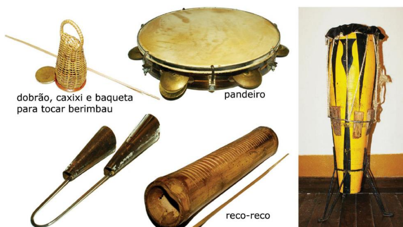
Figura 4 - No canto inferior esquerdo, agogô; e, à direita, atabaque.