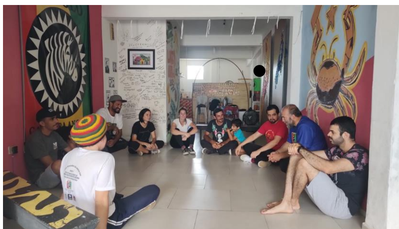
Figura 10 - Registro de conversa realizada ao final de uma aula.