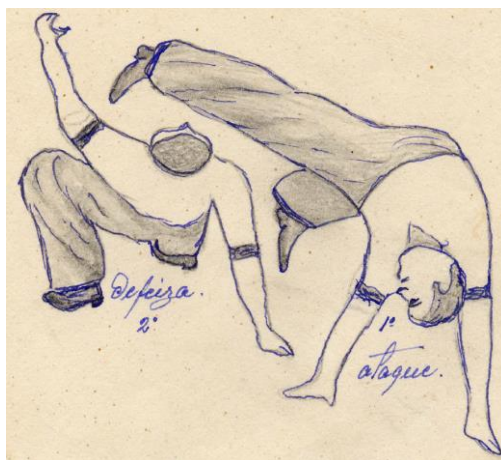
Figura 2 - Desenho de Mestre Pastinha.