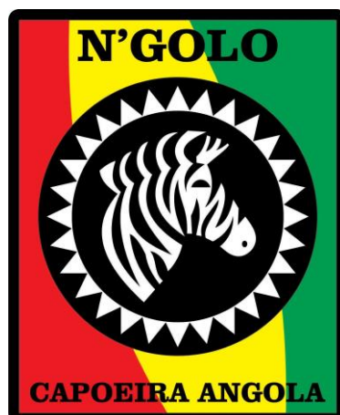
Figura 8 - Logotipo do Centro de Prática e Pesquisa N'Golo Capoeira Angola.