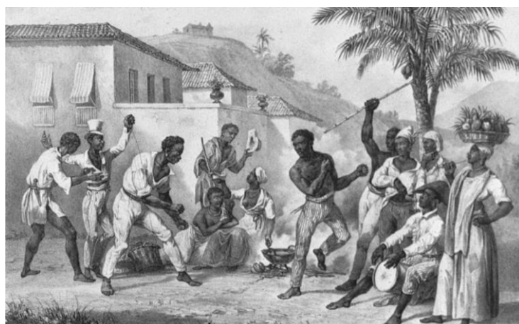
Figura 1 - "Dança de Guerra ou Jogar Capoeira" de Johann Moritz Rugendas (1835).