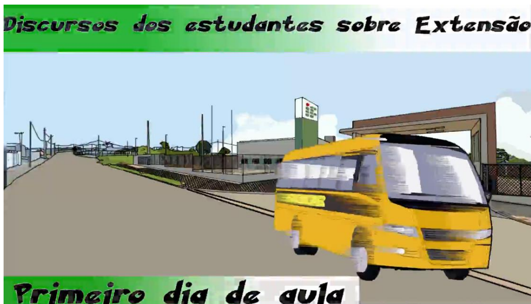
Figura 1 – Animações do Produto Educacional.