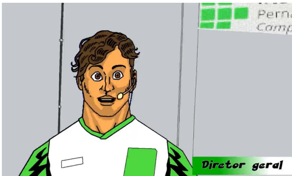
Figura 6 – Diretor apresenta os cursos e projetos do IFPE aos estudantes.