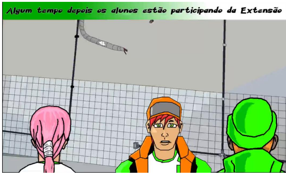
Figura 11 – Estudantes refletem sobre suas experiências na Extensão.