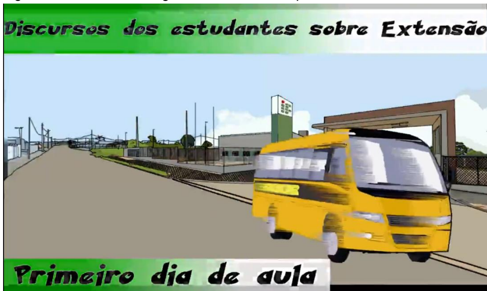
Figura 4 – Estudantes chegando no IFPE – Campus Palmares.