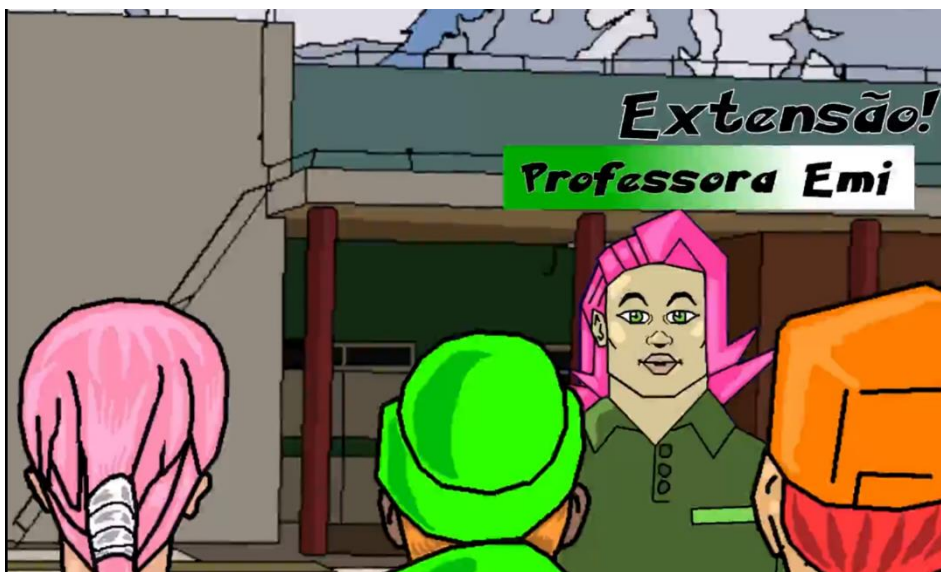
Figura 10 – Professora explica as funções de Ensino, Pesquisa e Extensão.