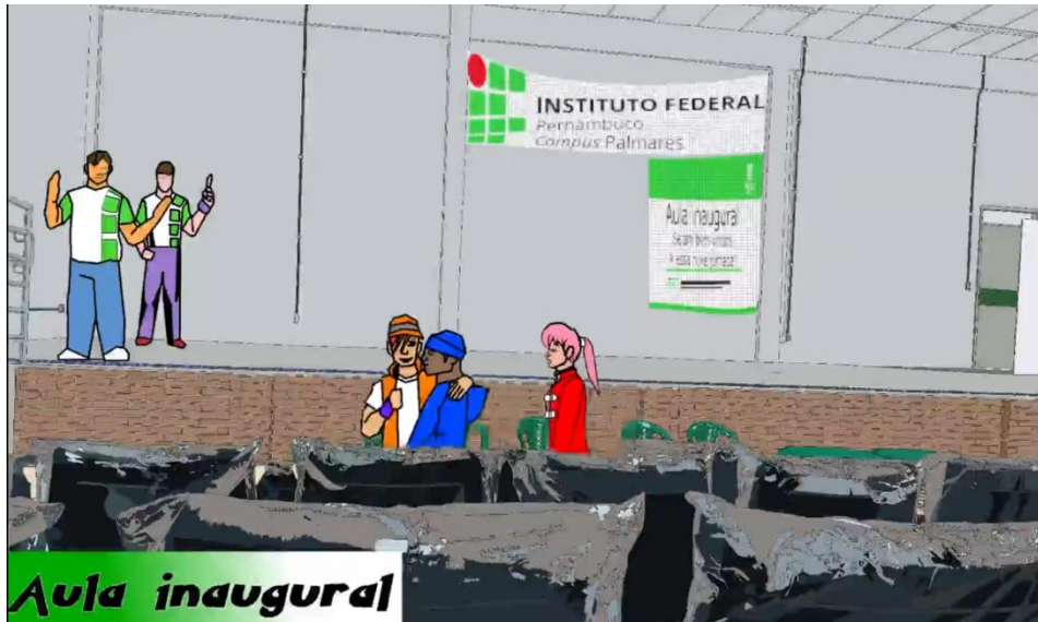
Figura 5 – Estudantes no auditório do IFPE – Campus Palmares.