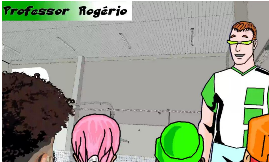
Figura 8 – Professor fala de seu projeto de Extensão em sala de aula.