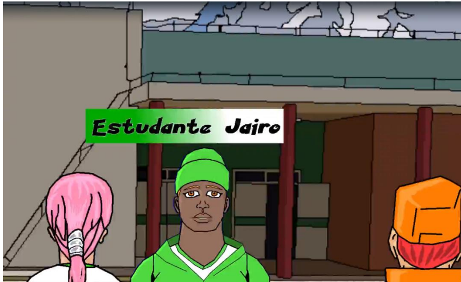
Figura 9 – Estudantes conversam após a aula sobre Extensão.