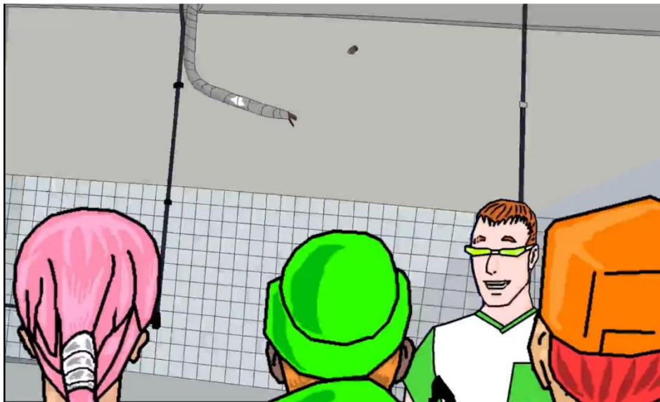
Figura 12 – Professor parabeniza os estudantes extensionistas.