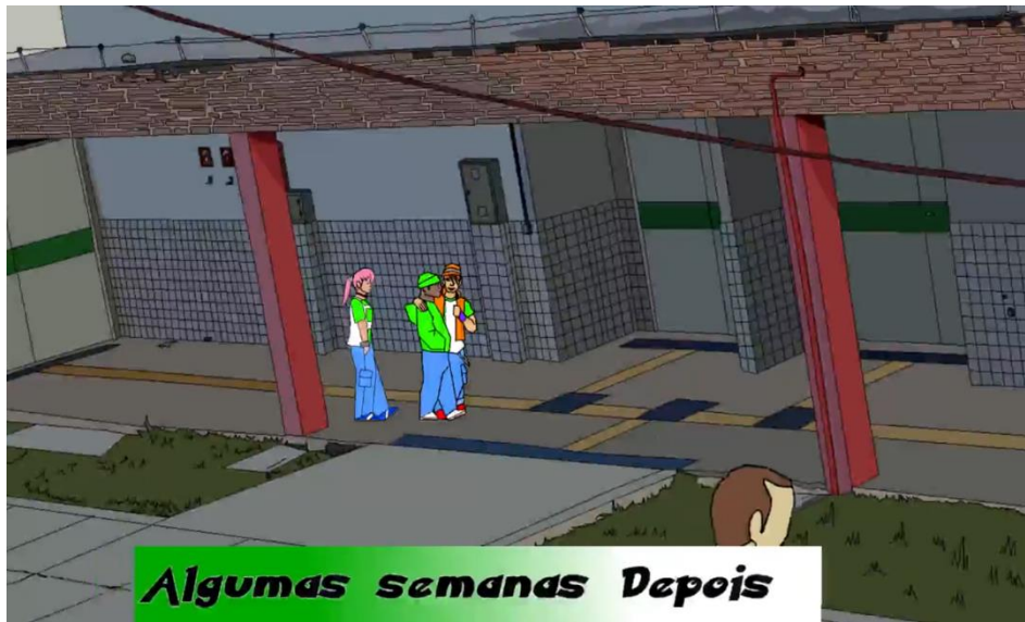
Figura 7 – Estudantes conversam no corredor do Campus sobre Extensão.