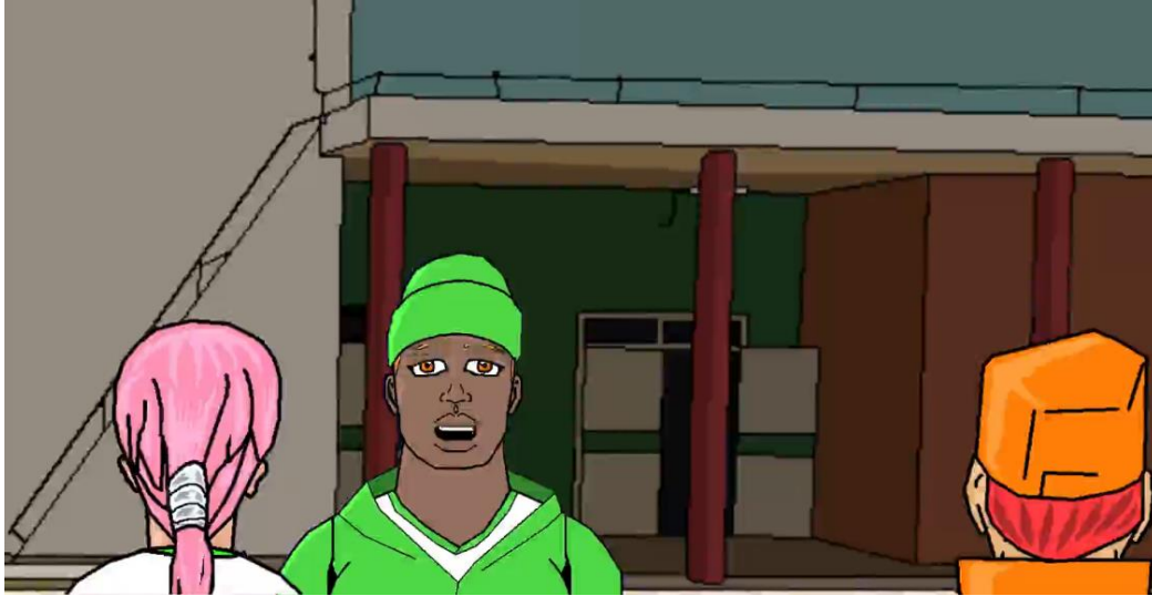
Figura 2 – Representação do visual dos estudantes.